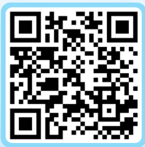
網上講座/工作坊報名表